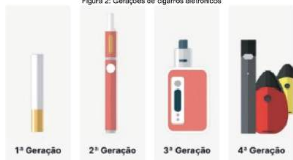
Figura 2: Gerações de cigarros eletrônicos

Dessa maneira, desde a disseminação do cigarro eletrônico, a sua produção evoluiu gerando uma variedade de dispositivos disponíveis no mercado, sendo categorizados em quatro gerações, cada uma com características distintas. Na primeira geração os dispositivos eram descartáveis que se assemelham visualmente aos cigarros tradicionais, tem bateria de baixa capacidade e cartuchos pré-preenchidos com e-líquido. Na segunda, ficaram conhecidos como "canetas de vape" ou "vape pens", sendo recarregáveis e reutilizáveis. A terceira geração disponibilizou maior personalização, com ajustes de potência, temperatura e fluxo de ar. Os cigarros eletrônicos de quarta geração são compactos e utilizam cápsulas pré-preenchidas ou recarregáveis (PEREIRA; SOLÉ, 2018). A Figura 2 evidencia uma representação visual das 4 gerações de cigarros eletrônicos comercializados.