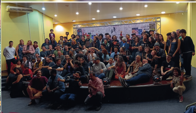
FESTIVAL DE TEATRO AMADOR ELIETE FERNANDES