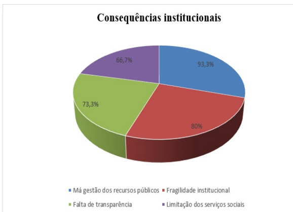
Gráfico 2. Consequências institucionais

Os dados evidenciam que a má gestão dos recursos públicos representa a principal consequência institucional da corrupção, estando presente em 93,3% dos documentos analisados. A fragilidade institucional aparece em 80,0% dos estudos, enquanto a falta de transparência e a limitação dos serviços sociais foram identificadas em 73,3% e 66,7% dos documentos, respetivamente.