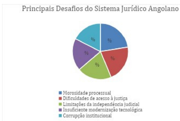
Gráfico 1 - Principais Desafios do Sistema Jurídico Angolano

Os resultados demonstram que a morosidade processual constitui o principal desafio identificado, estando presente em 90% dos documentos analisados.